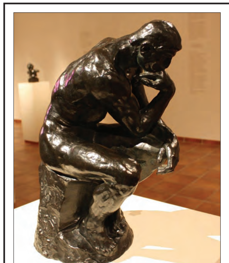
August Rodin se uitsonderlike werke was by die Rupert Kunsmuseum te sien.

Marais is nie bang om Engelse woorde en frases in sy gedigte in te werk nie. Maar die wyse waarop hy dit doen, spreek eerder van sy wêreldburgerskap as dat dit 'n poging is om die taalpuriste te ontstel.