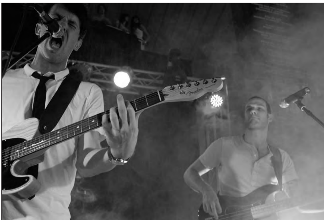
ON SONG: Zebra & Giraffe enthrall students at Geraas Innie Gat. The event took place at the Neelsie Student Centre on the campus of the Stellenbosch University.

The next band, Zebra & Giraffe, translated well from studio to live performance. I had been a little worried that the electronic elements would be